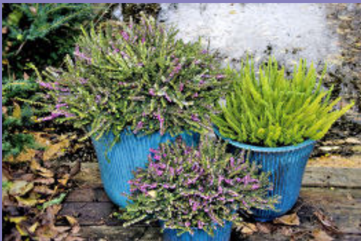
Laub- und Schneefall können Erica darleyensis kaum etwas anhaben. Sie wirken im großen und kleinen Gefäß gesund und munter. Die laubschöne hellgrüne Callune ergänzt das Ensemble erfrischend.

In Mitteleuropa wird Erica darleyensis – so der botanische Name – vor allem bei der Balkon- und Terrassenbepflanzung als Partner ab dem Spätsommer geschätzt. Im Herbst können Gaultherien, Enzian, Astern, Gräser und selbstverständlich andere Heidearten gut mit der Englischen Heide kombiniert werden. Im Winter er-