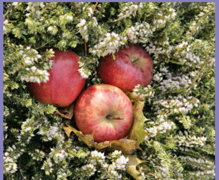
Die Äpfel sehen auf dem weißen Blütenteppich von Erica darleyensis so lecker aus, dass sie bestimmt ab und zu nachgelegt werden müssen. Im Winter können Tannenzapfen oder kleine Strohsterne auf der Heide die Stimmung adventlich gestalten.

Diese Erike ist etwas für den zweiten Blick. Aber wer sie kennengelernt hat, weiß sie zu schätzen. Klare, schöne Dekorationen sind mit ihr effektiv zu gestalten, so dass auch Floristen sie verstärkt verwenden. Einige schöne rotschalige Äpfel wirken beispielsweise auf dem Blütenteppich wie ein Stilleben. Auch Hagebuttenzweige verändern das Erscheinungsbild, vor allem wenn sie mit der englischen Heide im Kranz oder anderen Werkstücken verbunden werden. Puristen setzen die blütenreichen Töpfe auch unverziert als belebendes Element in unterschiedliche Dekorationen. Ein wahrer Allrounder!