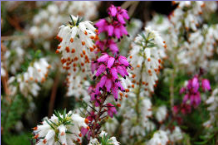
Das Märchenpaar Schneeweißchen und Rosenrot ist auch auf die Englische Heide übertragbar. Jede Farbvariante hat ihren eigenen Charme.

In Mitteleuropa wird Erica darleyensis – so der botanische Name – vor allem bei der Balkon- und Terrassenbepflanzung als Partner ab dem Spätsommer geschätzt. Im Herbst können Gaultherien, Enzian, Astern, Gräser und selbstverständlich andere Heidearten gut mit der Englischen Heide kombiniert werden. Im Winter er-